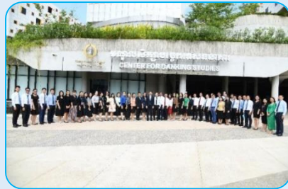
វគ្គបណ្តុះបណ្តាល ស្តីពីបទដ្ឋានអន្តរជាតិ និងច្បាប់និងបទប្បញ្ញត្តិប្រចាំការសម្អាតប្រាក់ និងហិរញ្ញប្បទានភេរវកម្ម ដល់មន្ត្រី-បុគ្គលិកអនាគតជាតិនៃកម្ពុជា នៅថ្ងៃទី១០ ខែឧសភា ឆ្នាំ២០២៤ នៅមណ្ឌលសិក្សាបច្ចេកទេសធនាគារ

អង្គការស៊ីបការណ៍ហិរញ្ញវត្ថុកម្ពុជា បានចាត់មន្ត្រីចូលរួមវគ្គបណ្តុះបណ្តាលក្នុង និងក្រៅប្រទេស ដែលរៀបចំដោយក្រសួង-ស្ថាប័នជាតិ និងអន្តរជាតិចំនួន ១៥ លើក ដោយមានមន្ត្រីចូលរួមសរុបចំនួន ៥៩ រូប។ ការចូលរួមវគ្គបណ្តុះបណ្តាលក្នុងប្រទេសមានចំនួន ៥ លើក ដែលរួមមានប្រធានបទ ១/- ការវាយតម្លៃហានិភ័យថ្នាក់ជាតិប្រចាំហិរញ្ញប្បទានដល់ការរីកសាយភាយ