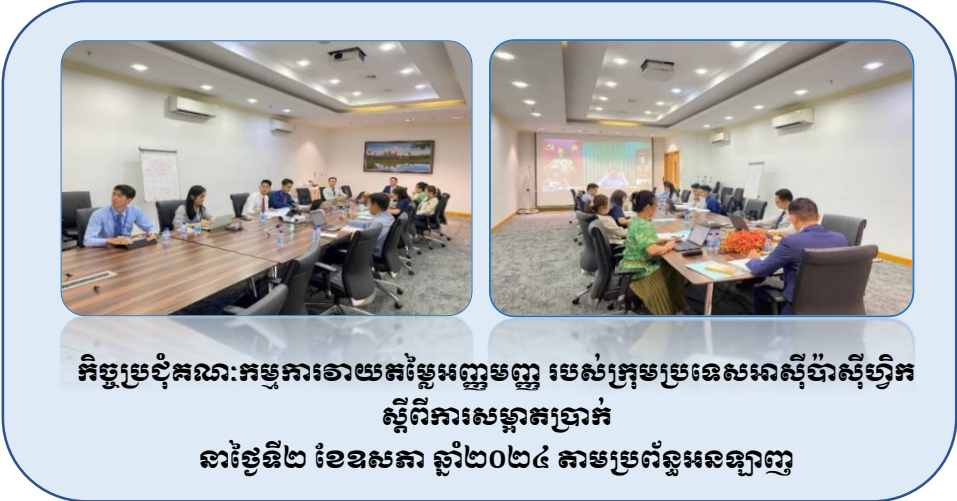
កិច្ចប្រជុំគណៈកម្មការវាយតម្លៃអញ្ញមញ្ញ របស់ក្រុមប្រទេសអាស៊ីប៉ាស៊ីហ្វិក ស្តីពីការសម្អាតប្រាក់ នាថ្ងៃទី២ ខែឧសភា ឆ្នាំ២០២៤ តាមប្រព័ន្ធអេឡិចត្រូនិច

ការវាយតម្លៃអញ្ញមញ្ញជុំទី២ របស់ក្រុមប្រទេសអាស៊ីប៉ាស៊ីហ្វិកស្តីពីការសម្អាតប្រាក់ ២/- ការស្ទង់មតិ របស់ក្រុមការងារហិរញ្ញវត្ថុ ពាក់ព័ន្ធនឹងអនុសាសន៍ទី១៥ ស្តីពីបច្ចេកវិទ្យាថ្មីៗ ៣/- កម្រងសំណួរ របស់ក្រុមការងារហិរញ្ញវត្ថុ ស្តីពីការវាយតម្លៃហានិភ័យថ្នាក់ជាតិ និង ៤/- ការអនុវត្តវិធានការ ចំពោះប្រទេសមានហានិភ័យខ្ពស់ដែលតម្រូវឱ្យមានវិធានការប្រឆាំង និងប្រទេសដែលត្រូវបង្កើន ការតាមដាន។