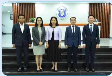
កិច្ចប្រជុំក្រុមប្រឹក្សាភិបាល នៃអង្គការស៊ើបការណ៍ហិរញ្ញវត្ថុកម្ពុជា លើកទី៥៧ នាថ្ងៃទី១២ ខែមិថុនា ឆ្នាំ២០២៤ នៅអគារអង្គការស៊ើបការណ៍ហិរញ្ញវត្ថុកម្ពុជា