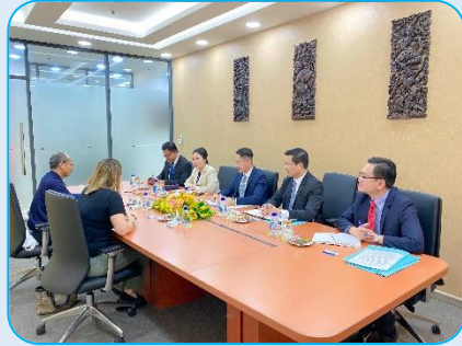
កិច្ចពិភាក្សារវាងអង្គការស៊ីបការណ៍ហិរញ្ញវត្ថុកម្ពុជា ជាមួយនគរបាលសហព័ន្ធអូស្ត្រាលី ប្រចាំកម្ពុជា នៅថ្ងៃទី៣១ ខែឧសភា ឆ្នាំ២០២៤ នៅអគ្គនាយកដ្ឋានស៊ីបការណ៍ហិរញ្ញវត្ថុកម្ពុជា