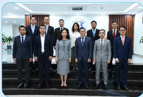
កិច្ចប្រជុំក្រុមប្រឹក្សាភិបាល នៃអង្គការស៊ើបការណ៍ហិរញ្ញវត្ថុកម្ពុជា លើកទី៥៦ នាថ្ងៃទី២៤ ខែមករា ឆ្នាំ២០២៤ នៅអគារអង្គការស៊ើបការណ៍ហិរញ្ញវត្ថុកម្ពុជា