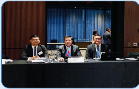
មហាសន្និបាតប្រចាំឆ្នាំ២០២៤ របស់ក្រុមការងារប្រឹក្សាយោបល់ ព័ត៌មានស៊ើបការណ៍ហិរញ្ញវត្ថុ ចាប់ពីថ្ងៃទី២១-២៤ ខែឧសភា ឆ្នាំ២០២៤ នៅទីក្រុងម៉ែលប៉ែន ប្រទេសអូស្ត្រាលី