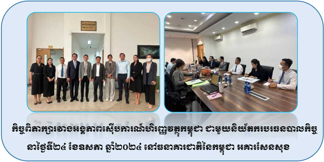
កិច្ចពិភាក្សារវាងអង្គភាពស៊ើបការណ៍ហិរញ្ញវត្ថុកម្ពុជា ជាមួយនិយ័តករធនបាលកិច្ច នាថ្ងៃទី២៤ ខែឧសភា ឆ្នាំ២០២៤ នៅវេនាសារជាតិនៃកម្ពុជា អគារសេនសុខ

ជាមួយគ្នានេះ អង្គភាពស៊ើបការណ៍ហិរញ្ញវត្ថុកម្ពុជាបានជួបប្រជុំជាមួយនិយ័តករធនបាលកិច្ចក្នុងគោលបំណងពិភាក្សាលើយន្តការត្រួតពិនិត្យលើបុគ្គលរាយការណ៍ ការលើកកម្ពស់ប្រសិទ្ធភាពនៃការអនុវត្តច្បាប់និងបទប្បញ្ញត្តិ ពាក់ព័ន្ធនឹងការប្រឆាំងការសម្អាតប្រាក់និងហិរញ្ញប្បទានភេរវកម្ម ការផ្លាស់ប្តូរព័ត៌មាន កិច្ចសហប្រតិបត្តិការ និងការចុះអនុស្សរណៈយោគយល់រវាងស្ថាប័នទាំងពីរ។