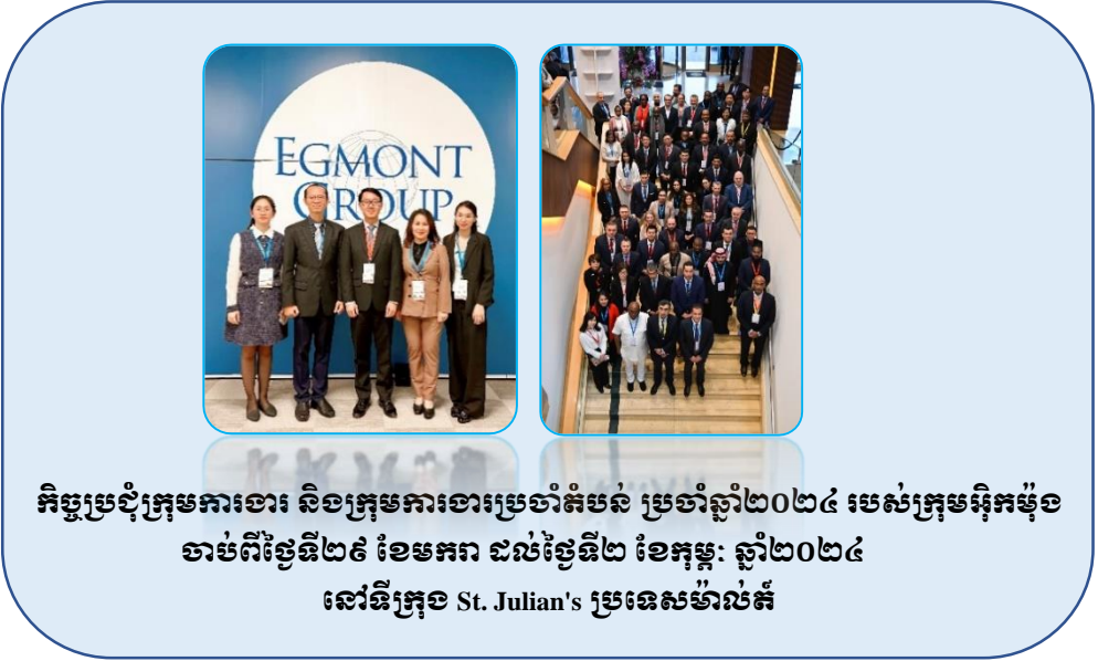
កិច្ចប្រជុំក្រុមការងារ និងក្រុមការងារប្រចាំតំបន់ ប្រចាំឆ្នាំ២០២៤ របស់ក្រុមអ៊ុកម៉ុង ចាប់ពីថ្ងៃទី២៩ ខែមករា ដល់ថ្ងៃទី២ ខែកុម្ភៈ ឆ្នាំ២០២៤ នៅទីក្រុង St. Julian's ប្រទេសម៉ាល់ត៍

អង្គការស៊ើបការណ៍ហិរញ្ញវត្ថុកម្ពុជា បានចូលរួមកិច្ចប្រជុំក្រុមការងាររបស់ក្រុមអ៊ុកម៉ុង និង ក្រុមការងារប្រចាំតំបន់អាស៊ីប៉ាស៊ីហ្វិករបស់ក្រុមអ៊ុកម៉ុង នៅទីក្រុង St. Julian's ប្រទេសម៉ាល់ត៍ ក្នុងគោលបំណងពិភាក្សាអំពីវឌ្ឍនភាពការងាររបស់ ១/- ក្រុមការងារផ្លាស់ប្តូរព័ត៌មាន ២/- ក្រុមការងារ ជំនួយបច្ចេកទេសនិងបណ្តុះបណ្តាល ៣/- ក្រុមការងារសមាជិកភាព ការគាំទ្រ និងអនុលោមភាព ៤/- ក្រុមការងារគោលនយោបាយនិងនីតិវិធី និង ៥/- ក្រុមការងារប្រចាំតំបន់អាស៊ីប៉ាស៊ីហ្វិក។